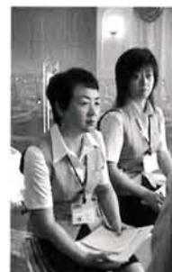
うらやましいですねー！

私達の時代は、ほとんど が神前式だったので、特に 憧れが強い感じがあります。 きっと素敵でしょうね。 とても素敵ですよ。でも 神前式も厳かでもとも良か ったですよ。 ところで、一日何組の挙 式が可能なんですか。