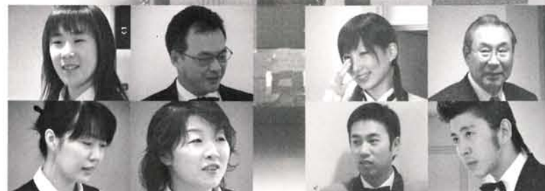
ウエディング スタッフの皆さん

一回の挙式に十五分〜二 十分かかります。その後披 露宴があれば、やはり一日 に二回くらいだと思います。 本日は夕方から始めるナ イトウエディングをやりた いと思っています。幸い夜 景もきれいだし、とても素 敵だと思っております。夕方 六時から始めると終了時間 が遅くなってしまうので、 まだ検討中です。 そうですね。本当に景色が いいですね。この美しい眺 めを利用しない手はないです よね。