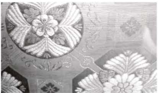
▲世界に1本しかない見事な模様の帯

顔の表情はやっぱり大事ですよ。それに豊唾者の人たちは手だけでなくて、口も読むしね。私たちより「言葉」に対して敏感ですよ。