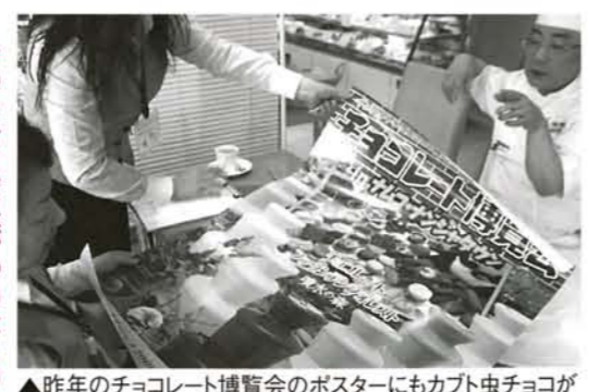
▲昨年のチョコレート博覧会のポスターにもカブト虫チョコが

それが何個作ったかもわからないんですよ。次から次と受けた注文を早くお客様に届けることだけを考えて作っていましたよ。