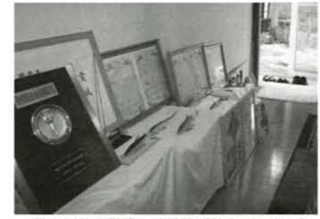
▲数々の特許登録証や賞状が並んでいました

ただ本格的に作り出したのは教師を辞めてこっちに来てからです。雪の積もった真冬の横手川に入って、震えながら試作品を泳がせたこともあります。今思うとかなり無茶したな(笑)