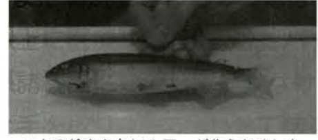
▲上の絵をもとにルアーが作られました