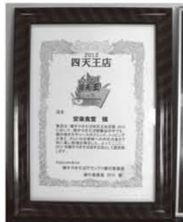
▲やきそば四天王の賞状