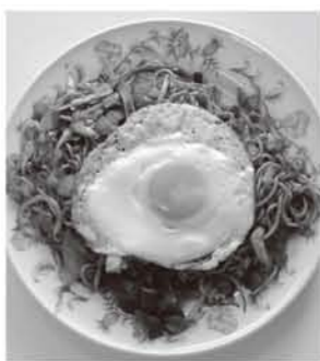
▲四天王に輝いた「やきそば」