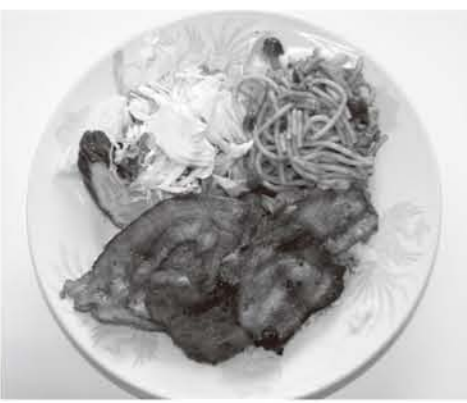
▲大人気の「焼肉ライス」

主人が考案したメニューです。お昼休みに手軽に食べれる美味しいものというところで…。実は、東京で修業していた頃から、店で人気になるメニューを研究していて、これに辿りついたようでした。