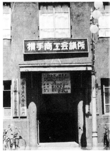
設立当時の商工会議所会館