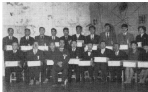
優良従業員表彰式