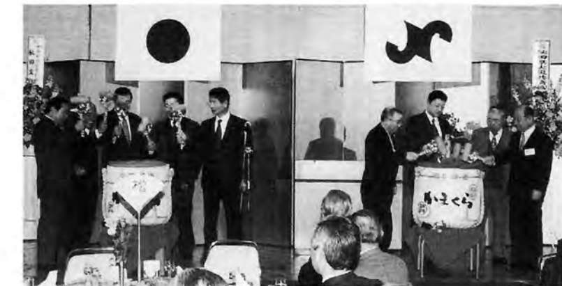
T R Y 21 設立祝賀会