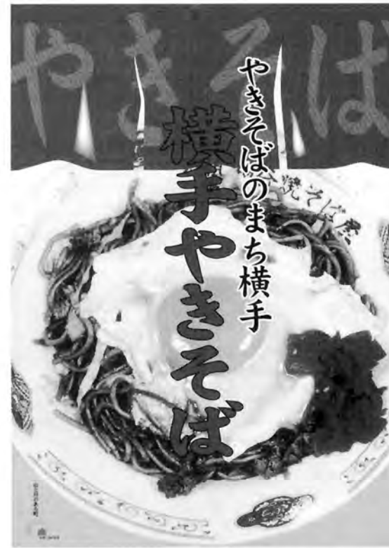
ブームになった横手焼そば