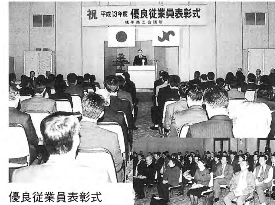
優良従業員表彰式