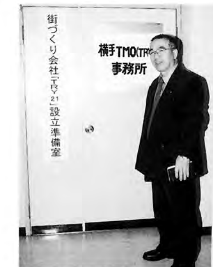
T R Y 21 事務所