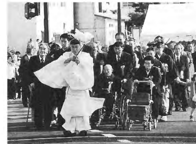
新蛇の崎橋開通式