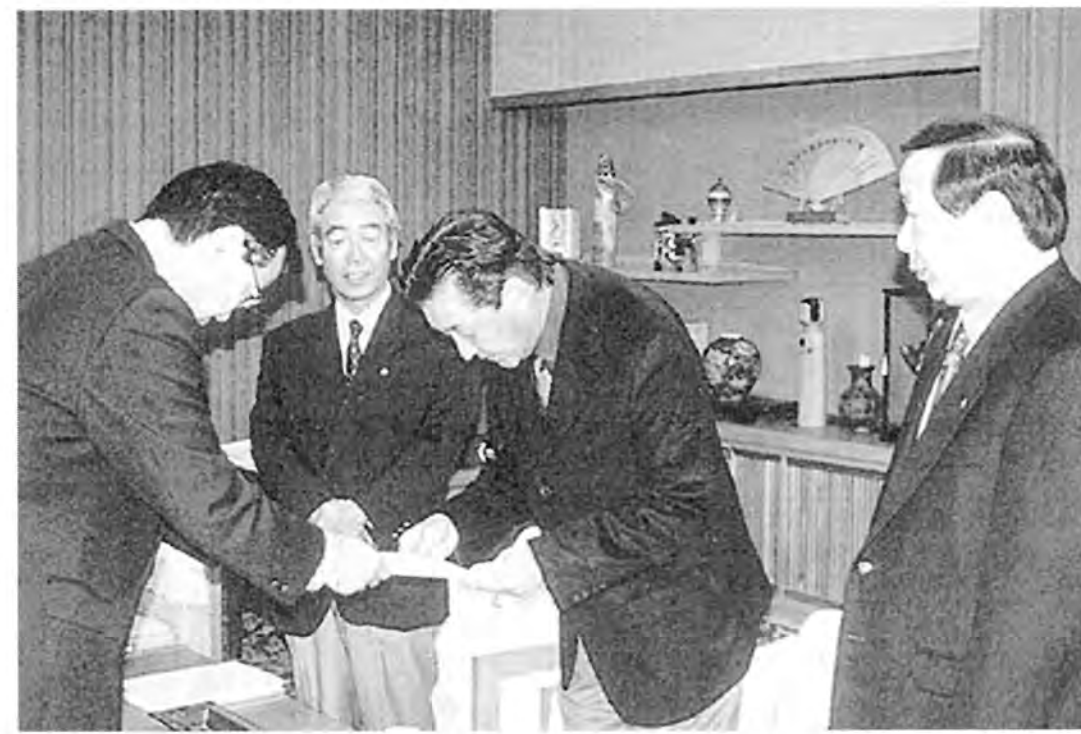
「TMO基本構想」市より認定