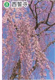
MEGA ドンキ