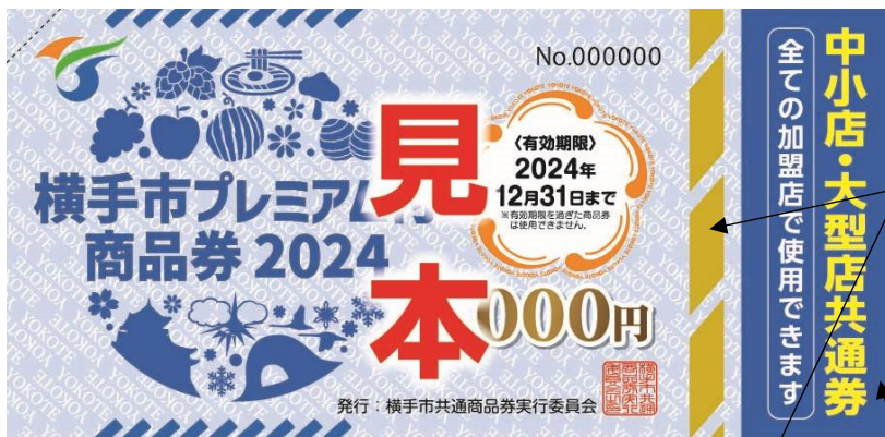
中小店・大型店共通券（あお色）