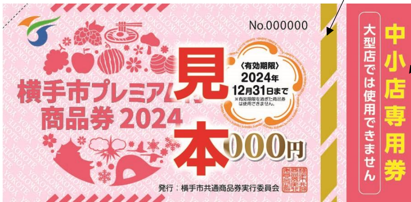
中小店専用券（ピンク色）